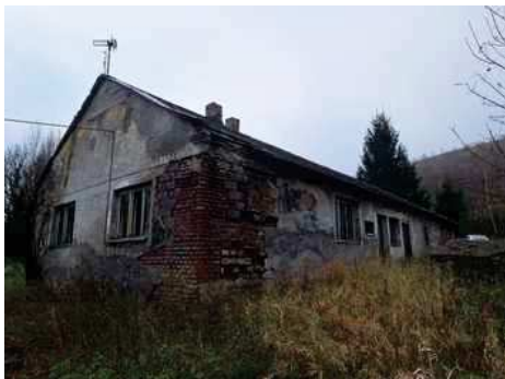
- stavba bez čp/če na p.č.st.304 - pohled