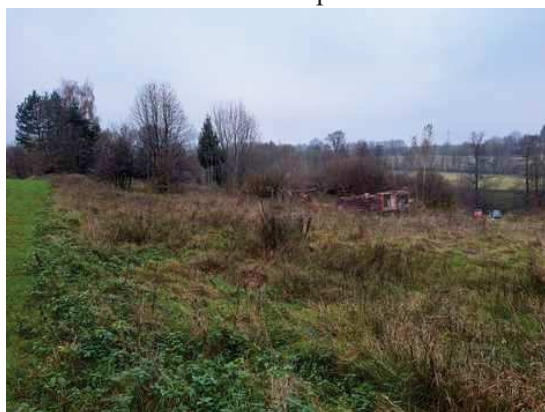
- celkový jižní pohled na p.č.89/1, 1382 a 85/2