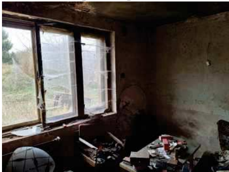
- stavba bez čp/če na p.č.st.304 - kuchyně