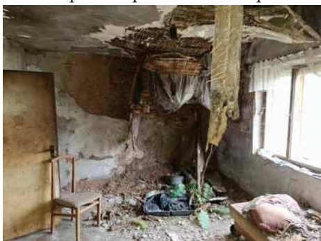
- stavba bez čp/če na p.č.st.304 - pokoj