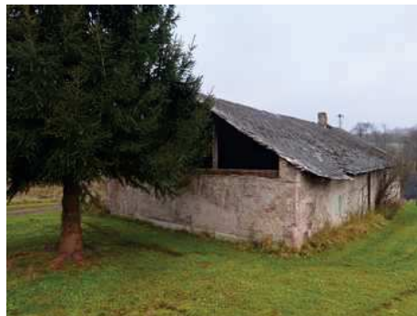
- stavba bez čp/če na p.č.st.304 - pohled