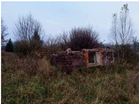
- zbořeniště na p.č.1382