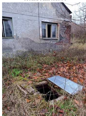
- stavba bez čp/če na p.č.st.304 - žumpa na pozemku p.č.86/3