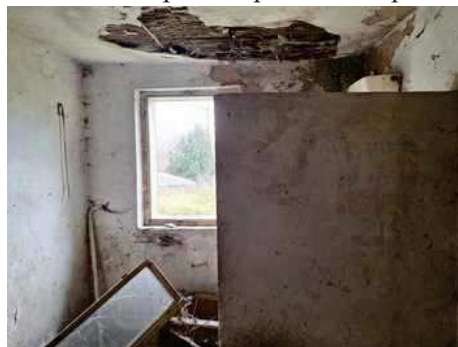
- stavba bez čp/če na p.č.st.304 - koupelna s WC