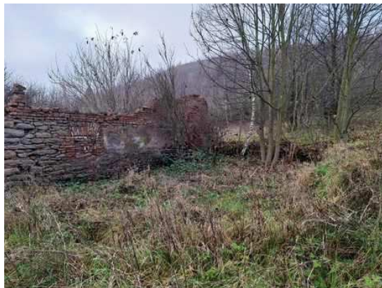
- zbořeniště na p.č.1382