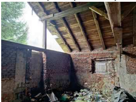
- stavba bez čp/če na p.č.st.304 - hospodářská část