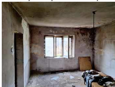
- stavba bez čp/če na p.č.st.304 - pokoj