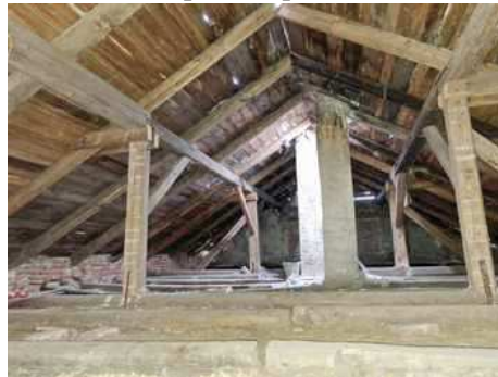
- stavba bez čp/če na p.č.st.304 - půda