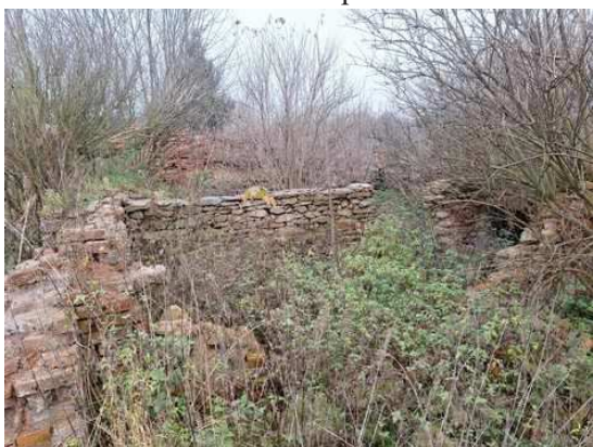
- zbořeniště na p.č.1382