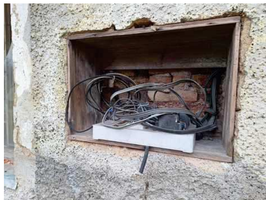
- stavba bez čp/če na p.č.st.304 - rozvody elektroinstalace