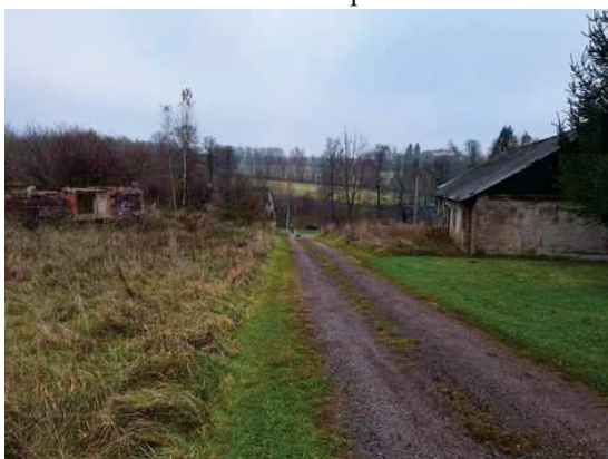
- účelová komunikace na pozemku p.č.85/2