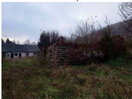
- zbořeniště na p.č.1382