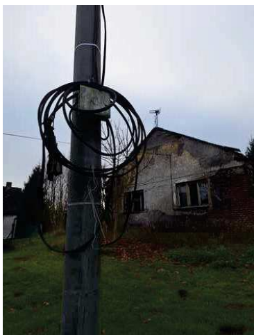
- ukončení přípojky elektro