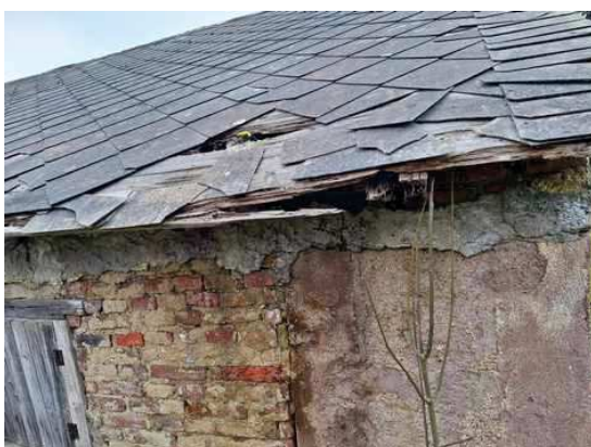
- stavba bez čp/če na p.č.st.304 - střešní krytina