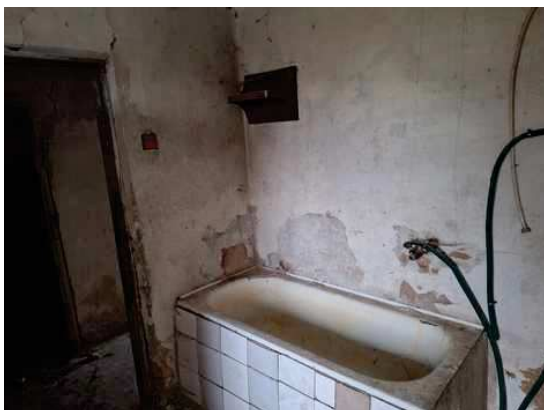
- stavba bez čp/če na p.č.st.304 - detail vybavení